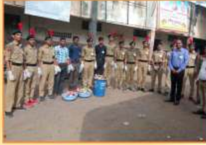
एन.सी.सी. विभाग द्वारा आयोजित 'स्वच्छ भारत अभियान' अंतर्गत बस स्टॅन्ड परिसर स्वच्छ करतांना कॅडेम्स