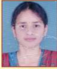
ढवु अश्विनी अवदुत एम. ए. इंग्रजी द्वितीय