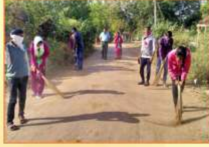
रा.सो.यो. स्वयंसेवक महाविद्यालय परिसरात श्रमदान करताना