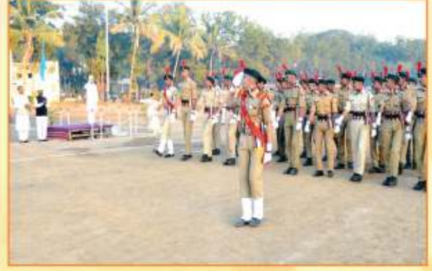
दि. २६ जानेवारी २०२० प्रजासत्ताक दिनानिमित्त ध्वजारोहण प्रसंगी परेडचे संचलन करतांना एन.सी.सी चे कॅडेट्स