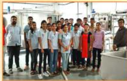
सूक्ष्मजीवशास्त्र बापू डेअरी येथे आयोजित अभ्यास सहल