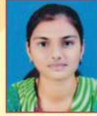
पवार गायत्री राजेश टी.वाय.बी.बी.ए. द्वितीय