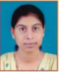
शिंदे सुषमा कैलास एम. ए. भूगोल प्रथम