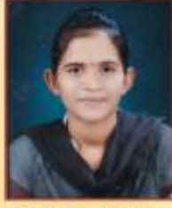
चौधरी वैशाली अंबक एम. एस्सी मायक्रोबायोलॉजी प्रथम