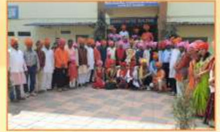
इतिहास विभाग आयोजित छत्रपती शिवाजी महाराज जयंतीनिमित्त 'शिवजन्मोत्सव' साजरा करतांना मान्यवर, प्राध्यापक व विद्यार्थी