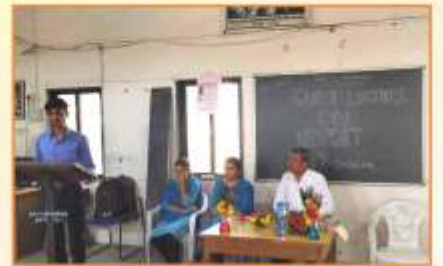
मायोक्ताबायोलॉजी विभाग आयोजित नेट-सेट परिक्षा मार्गदर्शन कार्यक्रम प्रसंगी उपस्थित मान्यवर