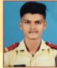
JUO भोई महेश वसंत