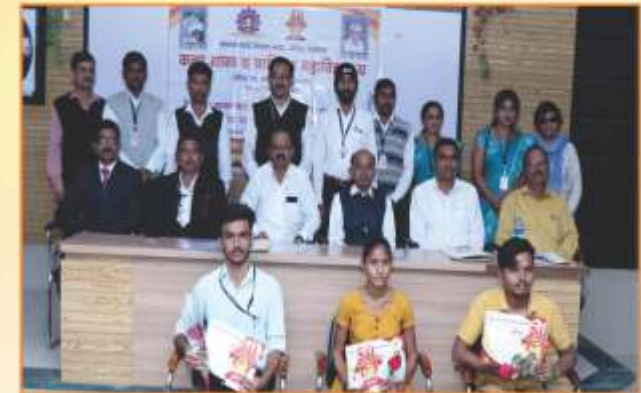
के. दादासाहेब डॉ. सुरेश जी. पाटील कनिष्ठ महाविद्यालय राज्यस्तरीय वक्तृत्व स्पर्धेत विजेत्यां समवेत मान्यवर