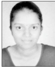
धनगर सुषमा कैलास द्वितीय वर्ष वाणिज्य