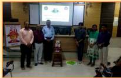
इलेक्ट्रॉनिक्स विभाग आयोजित 'इंजिनर्स डे' कार्यक्रम प्रसंगी उपस्थित मान्यवर