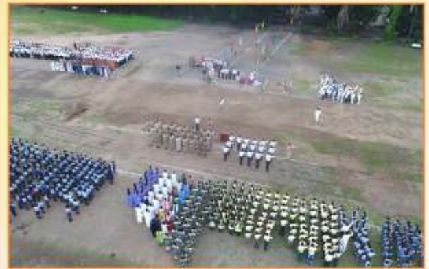
दि. १५ ऑगस्ट २०१९ स्वातंत्र दिनानिमित्त ध्वजारोहण प्रसंगी राष्ट्रीय ध्वजास मानवंदना देतांना मान्यवर, शिक्षकवृंद, शिक्षकेत्तर कर्मचारी व विद्यार्थी