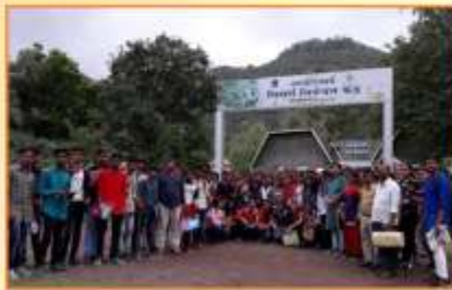
वनस्पतीशास्त्र विभाग आयोजित भास्कराचार्य निसर्ग निर्वाचन केंद्र पाटनादेवी वनक्षेत्र अभ्यास सहल