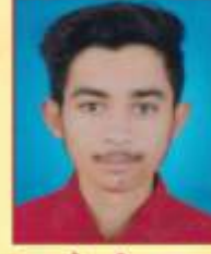
नगराळे प्रतीक माधव एफ.वाय.बी.ए. व्हॉलीबॉल विभाग खेळाडू