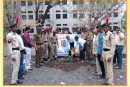
एन.सी.सी. विभाग द्वारा आयोजित 'वृक्षारोपण' कार्यक्रम प्रसंगी उपस्थित मान्यवर व कॅडेम्स