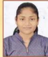
राजपूत प्रांजल ईश्वर BAMS, जळगाव