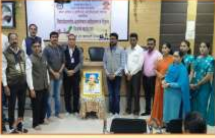
विद्यार्थी विकास विभाग आयोजित विद्यापीठस्तरीय श्रमसंस्कार व्यक्तिमत्व व नेतृत्व विकास कार्यशाळा प्रसंगी मा.श्री.साहेबराय पडलवार व उपस्थित मान्यवर