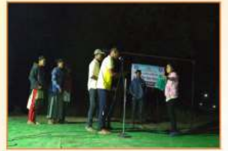
रा.से.यो. स्वयंसेवक 'सोशल मिडीयाचा गैरवापर' या ज्वलंत विषयावर पथनाट्य सादर करताना