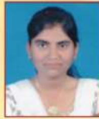
मोरे सोनिका मच्छाराम एम. ए. राज्यशास्त्र तृतीय