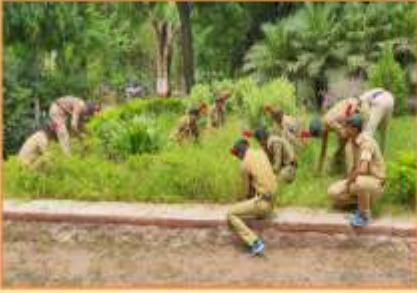
एन.सी.सी. विभाग द्वारा आयोजित 'स्वच्छ कॅम्पस ड्राइव्ह' प्रसंगी कॅडेम्स