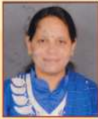
अगले उत्पलवर्णा जयप्रकाश एम. ए. राज्यशास्त्र प्रथम