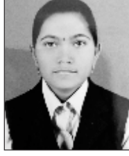
धनगर रोहिणी गोकुल प्रथम वर्ष कला

संग उजारेगी बचपन में उगली पकड सहारे से दौडी ऑऊगी रे पिता में तेरे एक इशारे से दो-दो कुल की जिम्मेदारी बेटी सदा निभाई है । कोई बता दो जगवालों । कैसे हुई पराई है ।