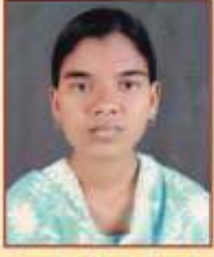
पावरा वंदना दीलत एम. एस्सी फिजिक्स प्रथम