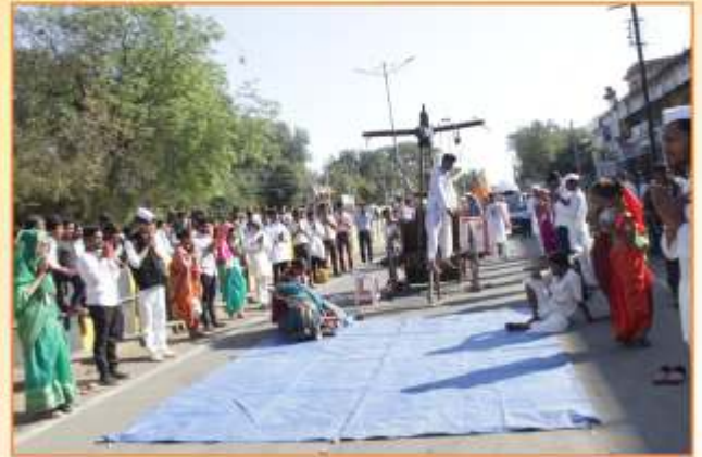
'युवारंग २०१९' शोभायात्रा प्रसंगी 'शेतकरी आत्महत्या' विषयावर सादरीकरण करतांना विद्यार्थी कलाकार