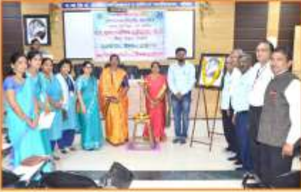
युवती सभा आयोजित एक दिवसीय व्यक्तिमत्व विकास कार्यशाळा उद्घाटन प्रसंगी उपस्थित मान्यवर