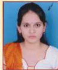
राजोड श्रद्धा दत्तात्रय टी.वाय.बी.ए.एस्सी गणित प्रथम