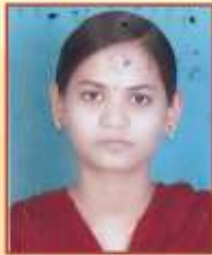
मंगरे पुजा नवल टी.वाय.बी.ए.एस्सी केमेस्ट्री द्वितीय