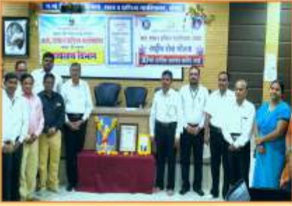
रा.सो.यो. विभाग आयोजित महामानव डॉ. बाबासाहेब आंबेडकर जयंतीनिमित्त आयोजित कार्यक्रम प्रसंगी उपस्थित मान्यवर