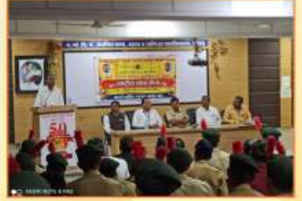
एन.सी.सी. विभाग द्वारा आयोजित 'रस्ता सुरक्षा चळवळ' कार्यक्रम प्रसंगी उपस्थित मान्यवर व कॅडेम्स