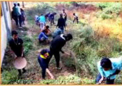
दत्तक गांव निमगव्हान येथील जि.प.शाळा स्वच्छता करताना रा.सो.यो. स्वयंसेविका