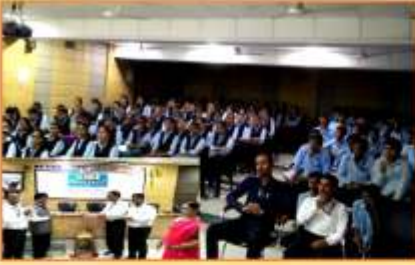
भौतिकशास्त्र विभाग आयोजित प्रश्न मंजुषा कार्यक्रम उद्घाटन प्रसंगी उपस्थित मान्यवर व विद्यार्थी