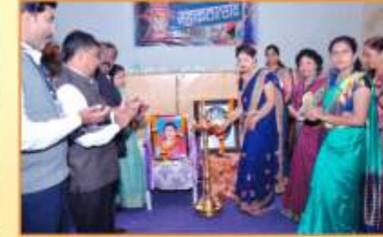
महिला तक्रार निवारण समिती आयोजित साडी डे कार्यक्रम प्रसंगी उपस्थित मान्यवर