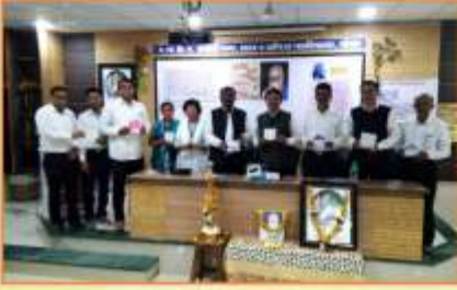
मराठी राजभाषा दिना निमित्त 'आमची मराठी आणि आमचे वाचन' या हस्तलिखिताचे विमोचन करतांना उपस्थित मान्यवर