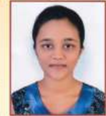
तायडे तनश्री प्रल्हाद BAMS, जळगाव