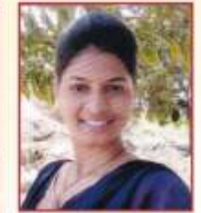
पावरा मिना शामसिंग एम.एस्सी झुलॉजी तृतीय