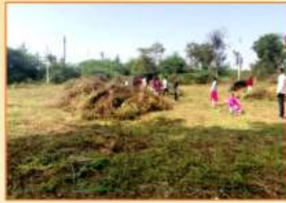
दत्तक गांव निमगव्हान येथील जि.प.शाळा स्वच्छता करताना रा.सो.यो. स्वयंसेविका