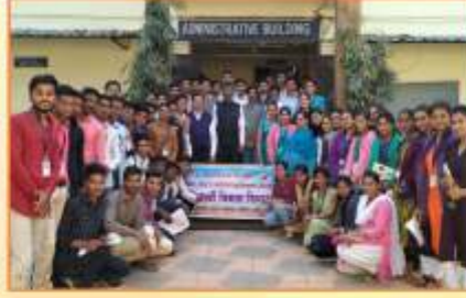
विद्यार्थी विकास विभाग आयोजित विद्यापीठस्तरीय श्रमसंस्कार व्यक्तिमत्व व नेतृत्व विकास कार्यशाळा प्रसंगी उपस्थित मान्यवर व विविध महाविद्यालयातील विद्यार्थी प्रतिनिधी