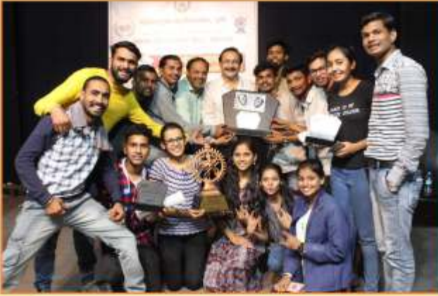
'पुरूषोत्तम करंडक २०१९' विद्यापीठस्तरीय सर्वोत्कृष्ट एकांकी स्पर्धा द्वितीय पारितोषिक प्राप्त आपला महाविद्यालय संघ