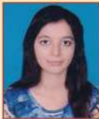
धनराज एकता विठ्ठल टी.वाय.बी.ए.एस्सी झुलॉजी द्वितीय