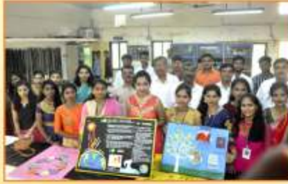
वनस्पतीशास्त्र विभाग आयोजित पोस्टर प्रेझन्टेशन प्रसंगी उपस्थित मान्यवर व विद्यार्थी