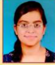
अग्रवाल पलक मनोज १२ वी कॉमर्स, द्वितीय