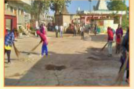
दत्तक गांव निमगव्हान मुख्य चौकात ग्राम स्वच्छता करताना रा.सो.यो. स्वयंसेविका