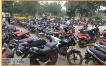
संस्था व महाविद्यालयात महिन्याच्या प्रत्येक शनिवारी 'नो व्हेकल डे' असतो