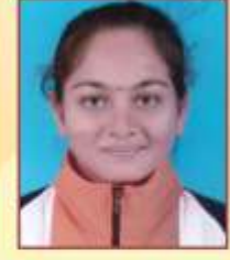
वाघ पुजा ज्योतेश्वर एफ.वाय.बी.ए. टेबल टेनीस विद्यापीठ खेळाडू