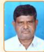
श्री. एम. एम. ठाकरे प्रयोगशाळा परिचर