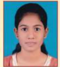
विसावे पळुवी कैलास टी.वाय.बी.ए.एस्सी फिजिक्स तृतीय