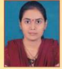
शिंदे आरती राजेंद्र एम. ए. मराठी द्वितीय